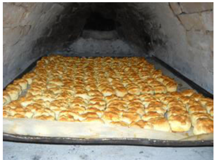
Tájház, kenyérsütő ház