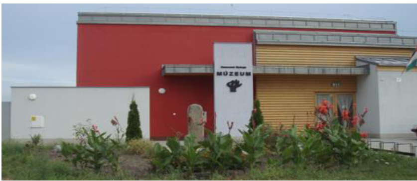
Konecsni György Múzeum