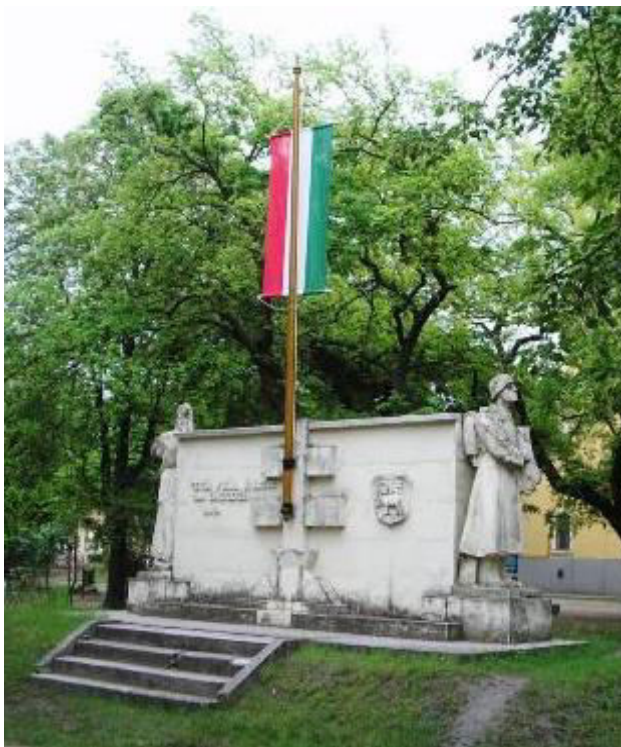
I. világháborús emlékmű