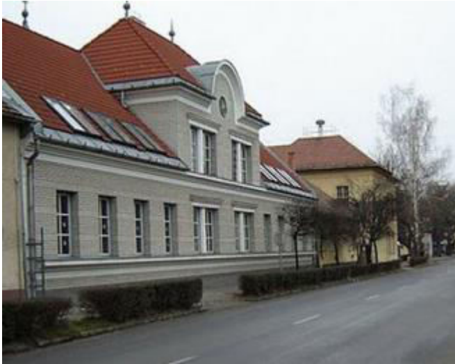
Arany János Általános Iskola