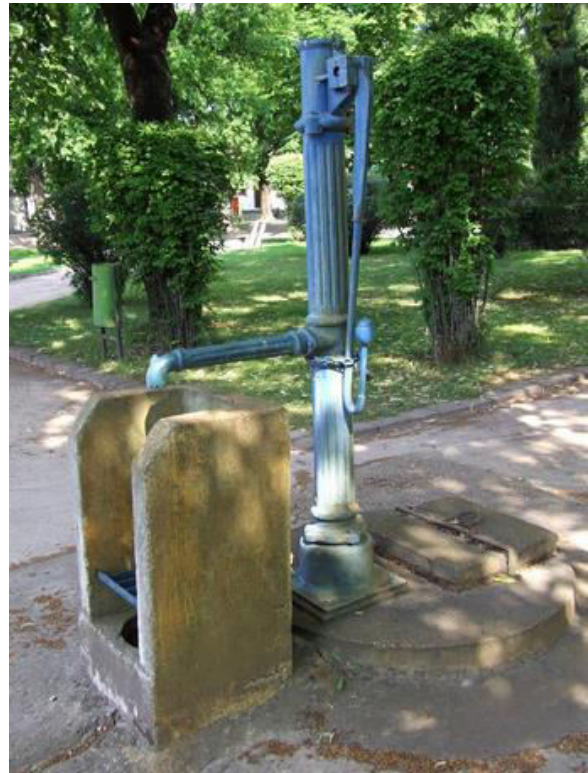
a főtér (az egykori piac) nyilvános kútja

A tér másik oldalán a Művelődési Központ, előtte esténként a fényhatásokkal játszó szökőkút áll.