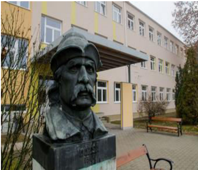
Dózsa György Gimnázium