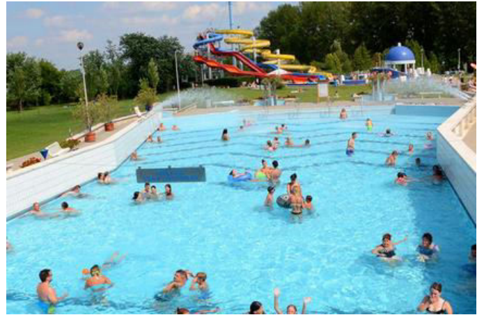
Jonathermál Gyógy- és Élmenyfürdő