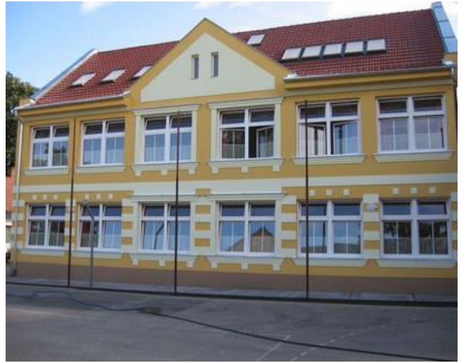
Szent Gellért Általános Iskola