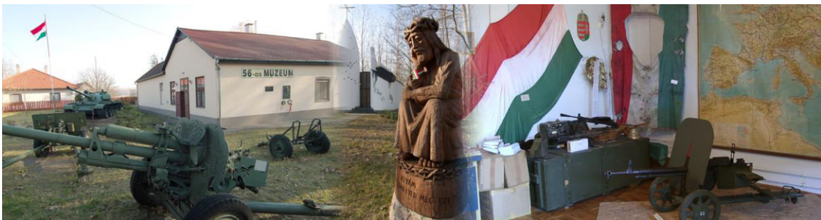
Az '56-os múzeum