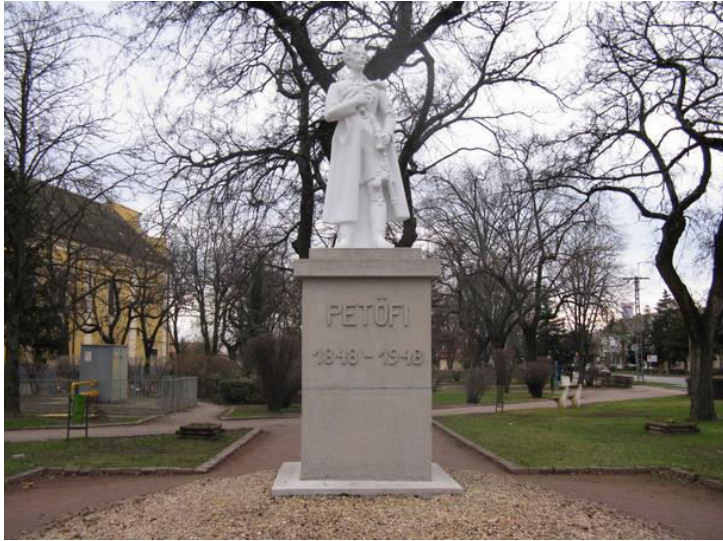
Petőfi Sándor szobra